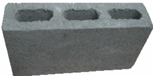
GBTL – 09