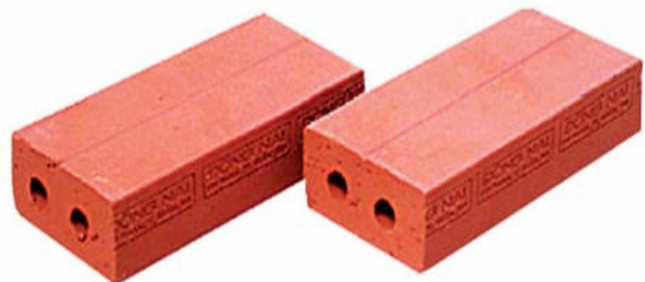
G03: 90 x 45 x 190 mm