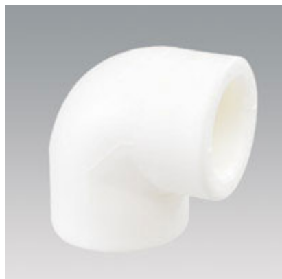
Rắc co nhựa