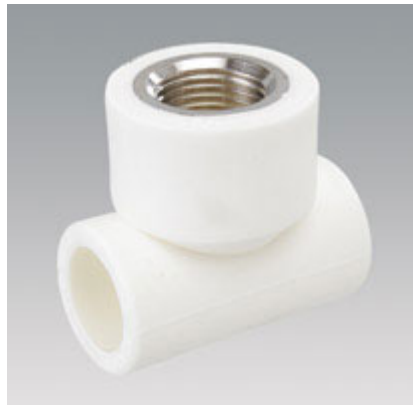
Rắc co ren ngoài