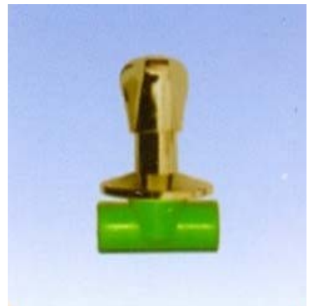
Van Inox dài