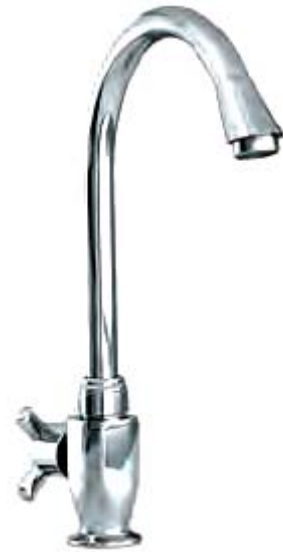
VG-707 – 1 đường nước