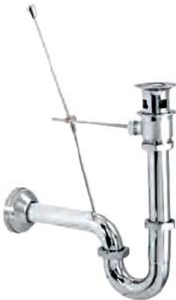
SP1: Siphông thanh giạt thẳng