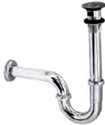
SP4: Siphông lật