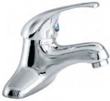
VG-301, 302, 303