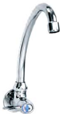
VG-709 – 1 đường nước