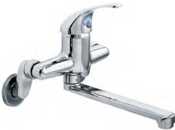
VG-701 – nóng lạnh