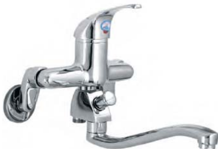
VG-509 – Sen tắm bồn