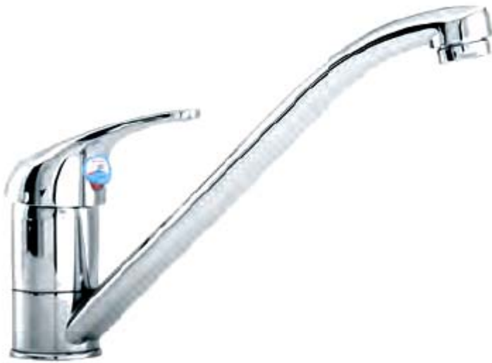
VG-704 – nóng lạnh