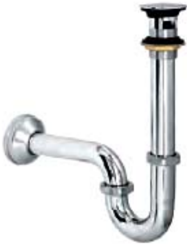
SP3: Siphông lật