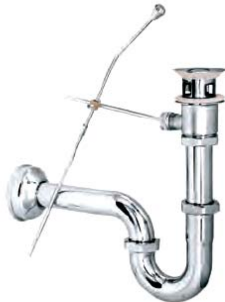
SP11: Siphông thanh giạt cong