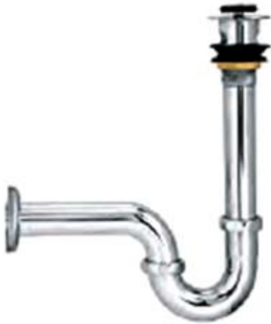
SP2: Siphông nhấn