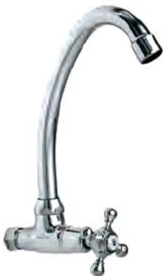
VG-708 – 1 đường nước