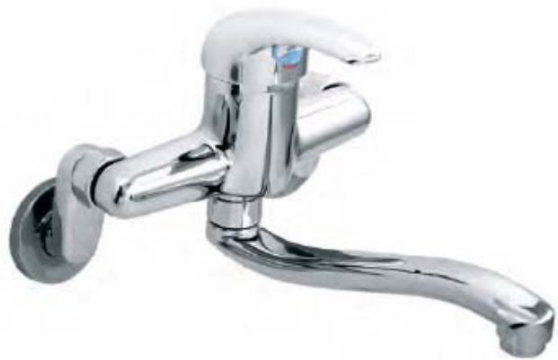
VG-702 – nóng lạnh