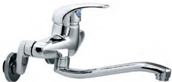
VG-703 – nóng lạnh